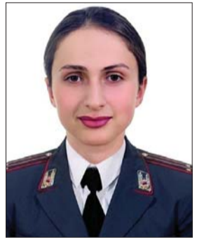
...Ինձ քո գիրկն առ ու տա՛ր աշխարհից. Դրախտ է գիրկդ, գրկի՛ր ինձ նորից ...

Ու նորից լինեմ այնքան երջանիկ, Ինձ ամուր գրկիր, որ չհեռանամ եվ նորից դառնամ մի անհոգ մանկիկ: